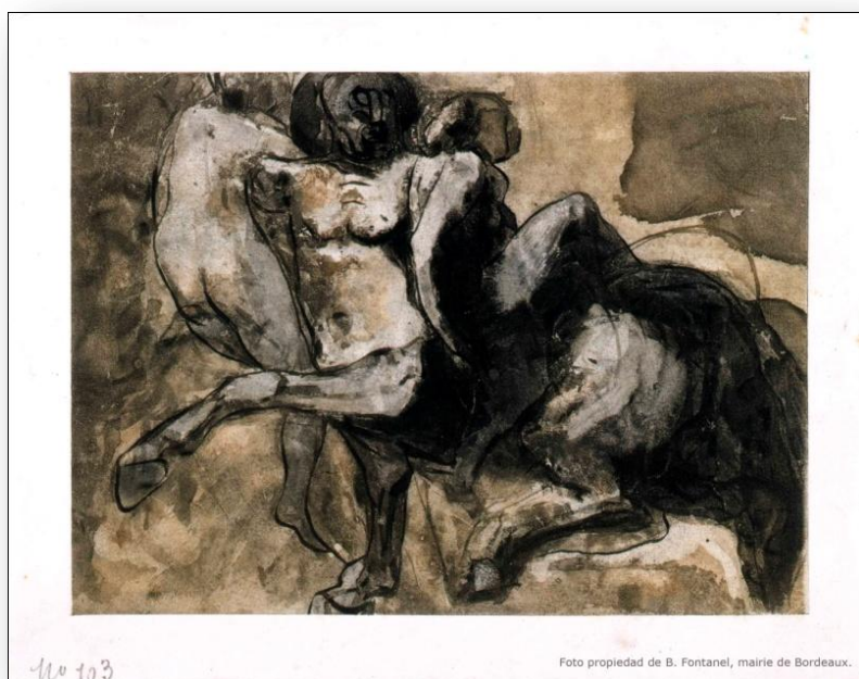
Centaure (Planche n° 49) D'après Auguste Rodin Bon à tirer 29 1897 Photogravure en couleur Inv. 90.I.2.2585 43 x 31 cm