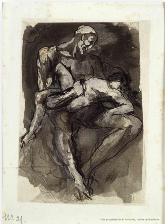
Ugolin dans sa prison (Planche n° 50) D'après Auguste Rodin Bon à tirer 21 1897 Photogravure en couleur Inv. 90.I.2.2577 43 x 31 cm Collection Musée Goupil, Bordeaux