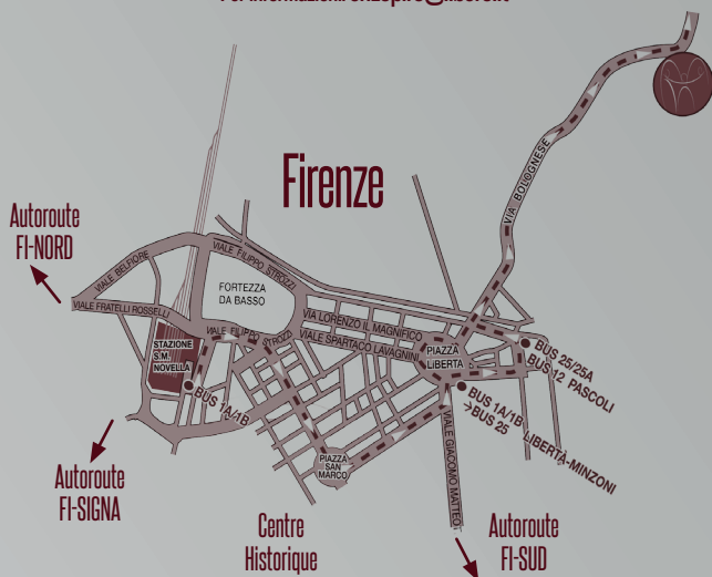
Conception graphique: Julia Cocosila